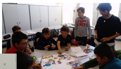
École Les Marsauderies (Nantes)