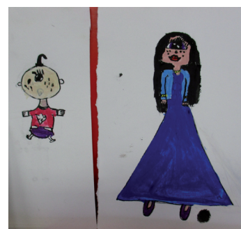
École Beauregard (Saint-Herblain)