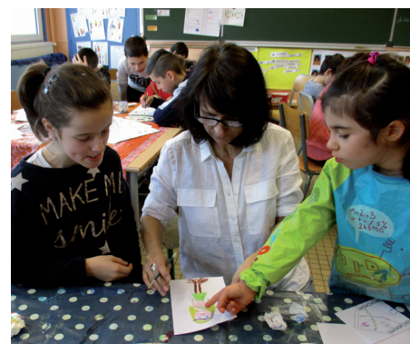
École Beauregard (Saint-Herblain)

Après avoir trouvé les familles, il est temps de les dessiner !