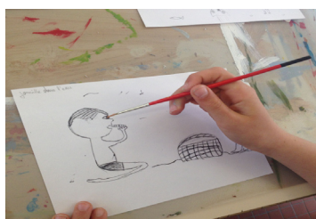
École Anatole France (Blain)